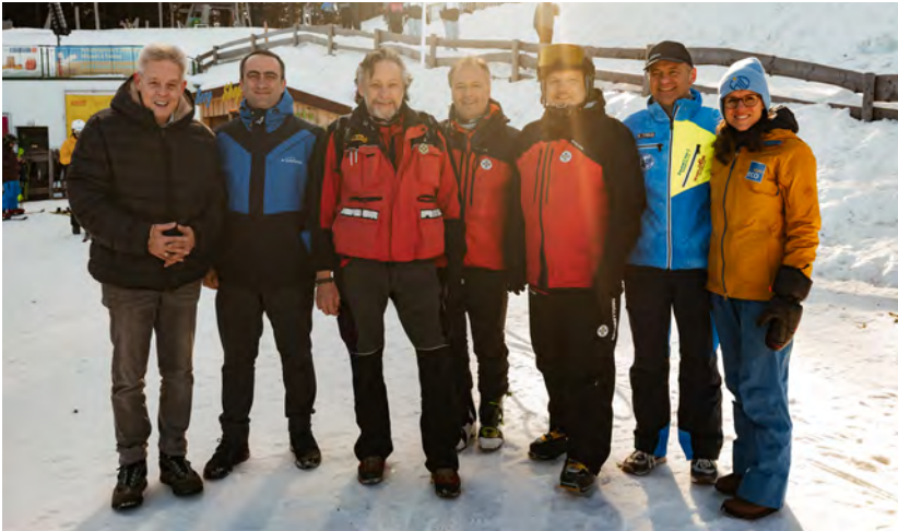
Winterfest der Freunde der Berge am 27. Jänner 2024

am 27. Jänner 2024 haben dazu beigetragen, die Beziehungen des Semmering Hirschenkogels zu anderen Skigebieten in der Region sowie zwischen lokalen Partnern und Organisationen zu stärken. Der Rettungsdienst, die Skiverleih-Stationen, die Semmeringer Skischulen, der Happy Lift, die Gemeinde und der Wintersportverein Semmering haben mit den Bergbahnen erfolgreich zusammengearbeitet, um ein tolles Programm zu bieten.