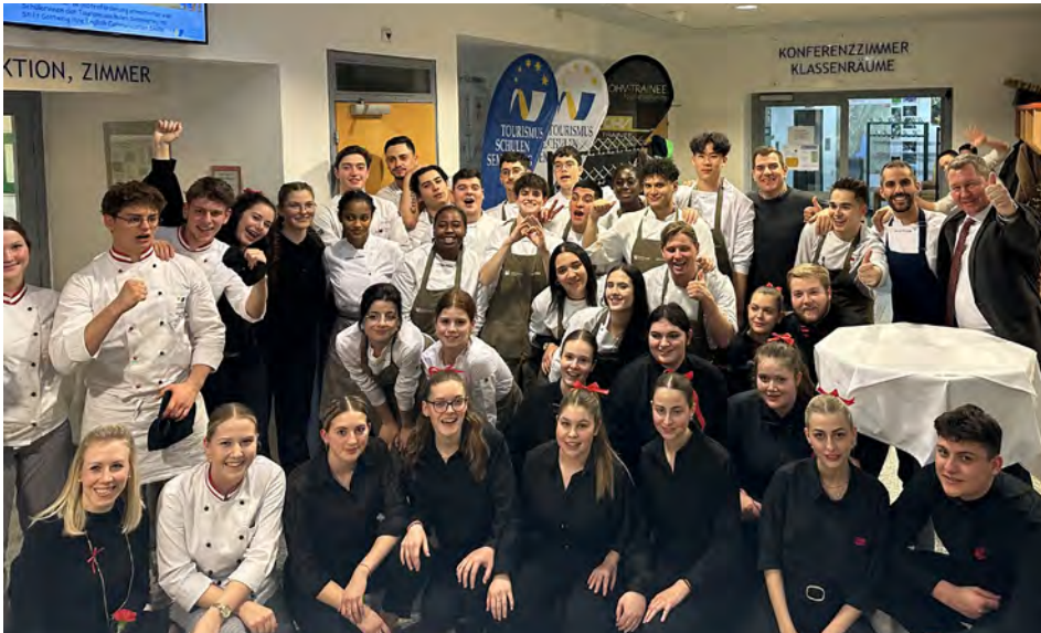
Bei einem Galadinner wurde die bereits acht Jahre währende Freundschaft mit der Partnerschule Jesuïtes Sarrià – Sant Ignasi aus Barcelona zelebriert.

Bereits jetzt freut sich die 4BHL auf ein Wiedersehen im Herbst beim Besuch der Partnerschule in Barcelona, um dabei heimische Gerichte beim österreichischen Gourmetdinner präsentieren zu können.