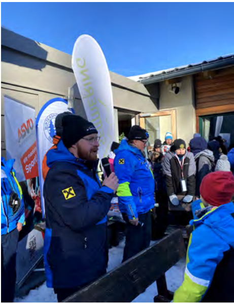
ASVÖ NÖ Familien Wintersporttag am 21. Jänner

Am 18. Mai 2024 beginnt die Sommersaison am Semmering Hirschenkogel. Die genaueren Betriebszeiten werden noch im April bekannt gegeben. Viele Gäste freuen sich bereits auf die Saisoneroöffnung, denn der Semmering Berg ist immer eine Gelegenheit, eine Flucht aus der Hitze und dem Trubel der Stadt mit sportlicher Aktivität und kultureller Entspannung zu verbinden.